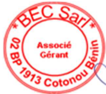
Serge MENSAH Associé-Gérant Expert en passation des marchés Expert-Comptable Diplômé