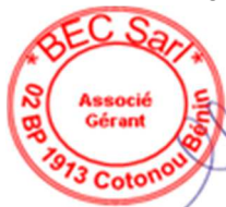
Serge MENSAH Associé-Gérant Expert en passation des marchés Expert-Comptable Diplômé