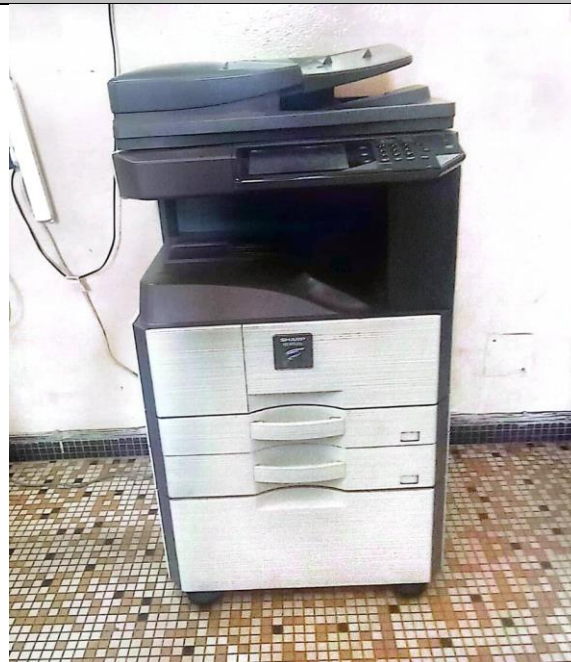
I 5 – Photo du copieur affecté au Secrétariat DAF