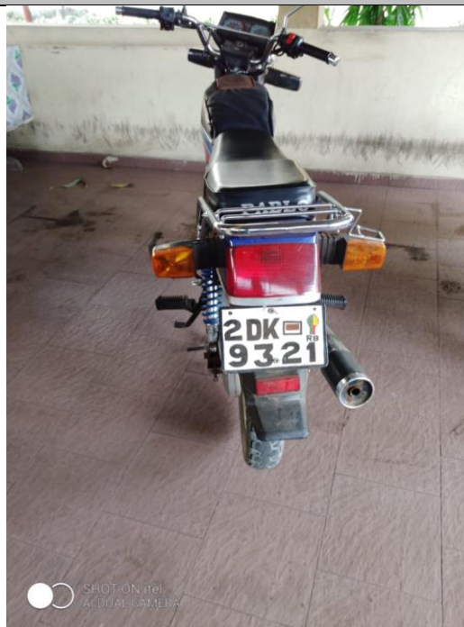
I 7 – Photo de la moto de l'agent de liaison visitée au siège de la HAAC