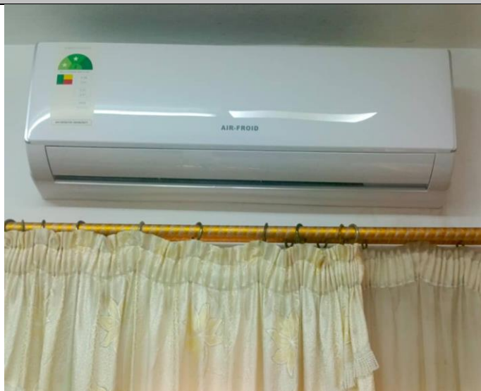
I 8 – Photo du climatiseur du bureau du Régisseur visité au siège de la HAAC