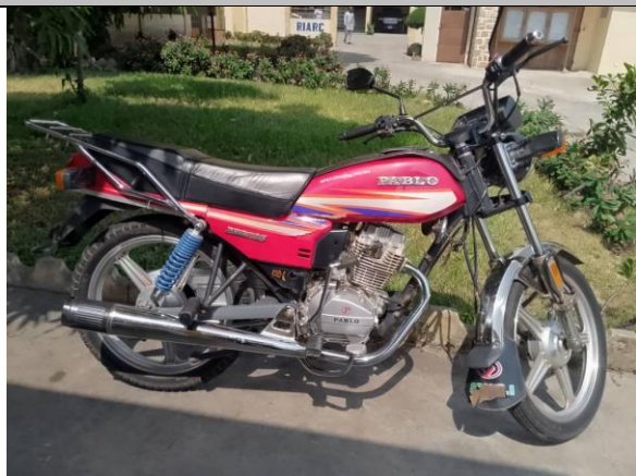
I 6 – Photo d'une moto visitée au siège de la HAAC