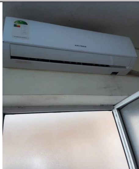
I 9 – Photo du climatiseur du bureau des CVA visité au siège de la HAAC