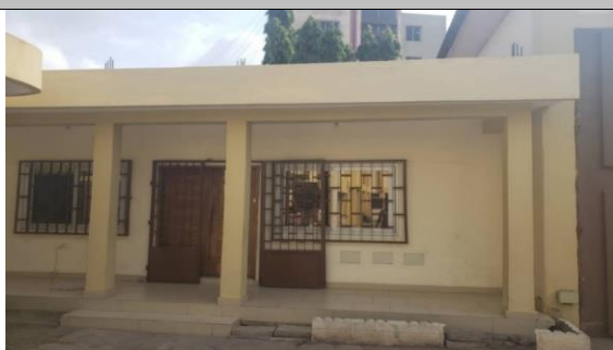
I 1 – Photo de la façade du bâtiment réaménagé