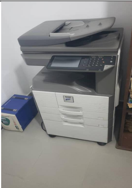
I 4 – Photo du copieur affecté à la PRMP