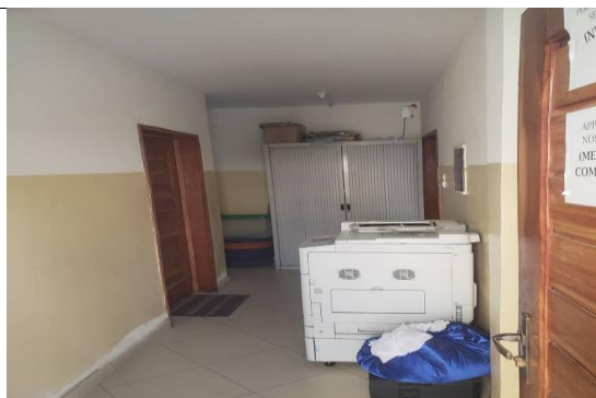
I 2 - Premier couloir du bureau réaménagé donnant accès à l'entrée