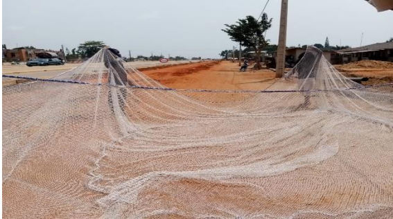
Réalisation de 100 poches de filets de 5x5x2 m pour renforcer les capacités des pisciculteurs en infrastructures aquacoles : SEME 1