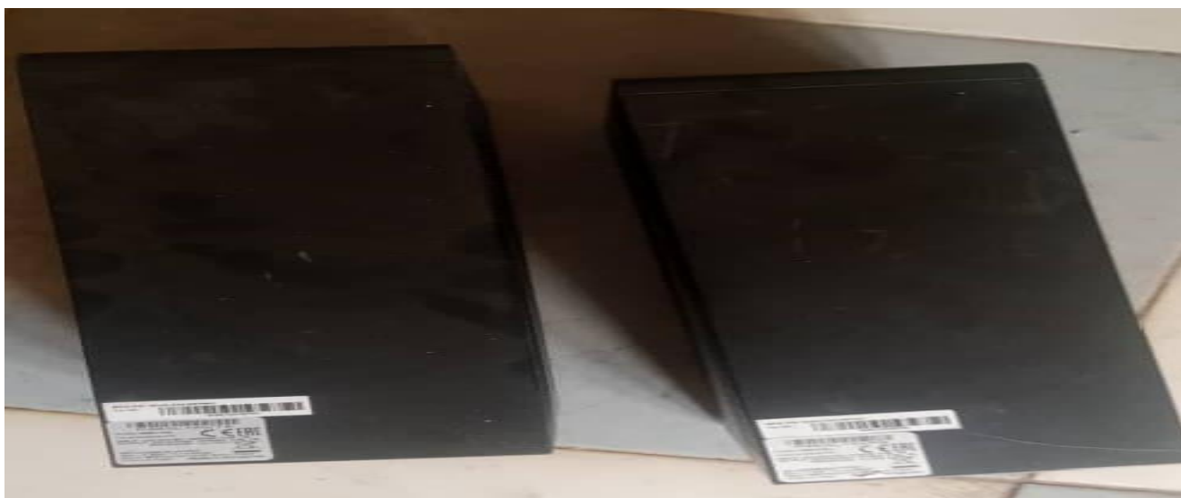
I 1 – Photo de quelques onduleurs visités