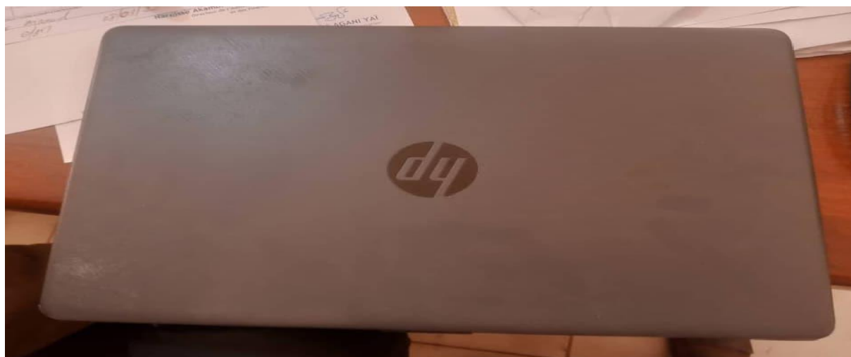
I 2 – Photos de quelques ordinateurs portatifs visités