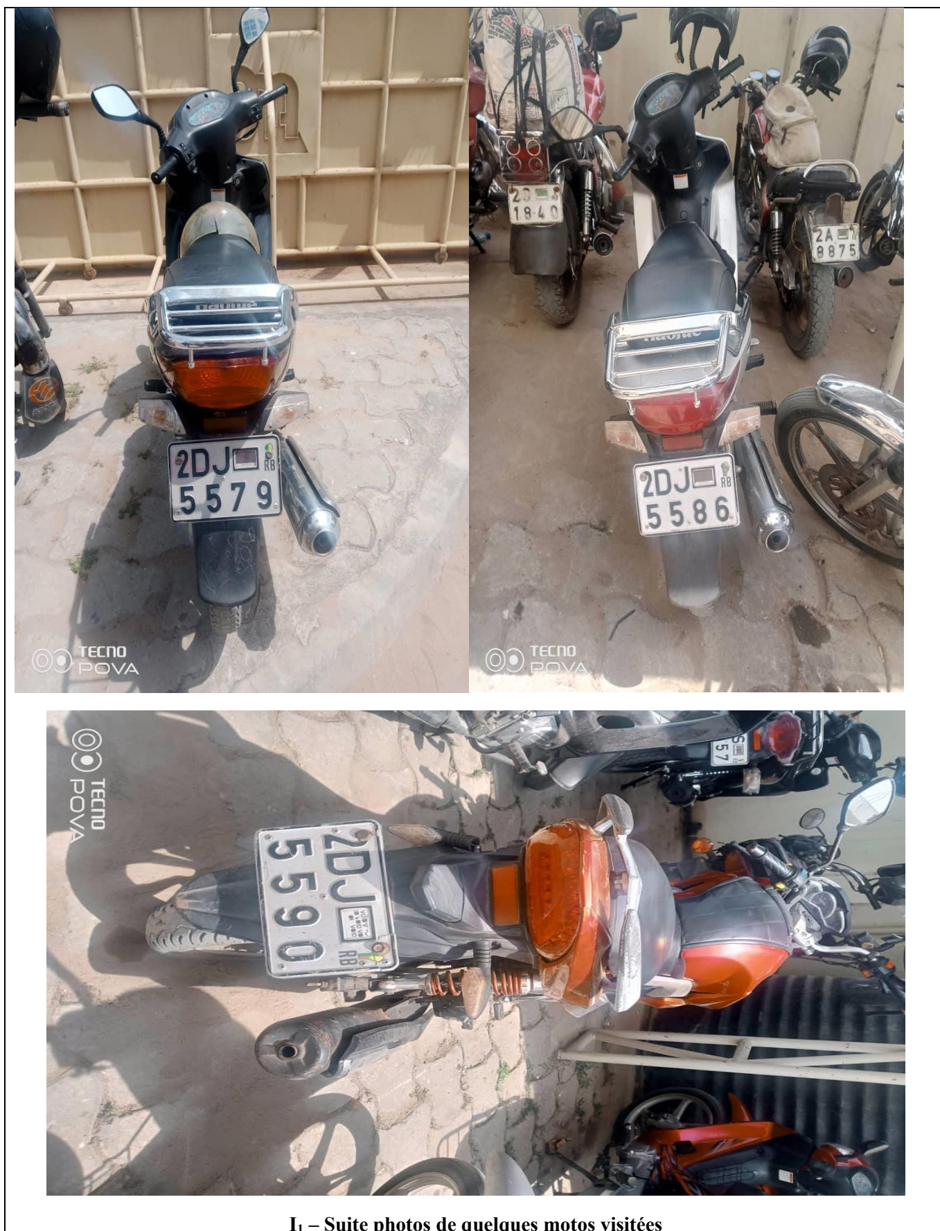
I 1 – Suite photos de quelques motos visitées