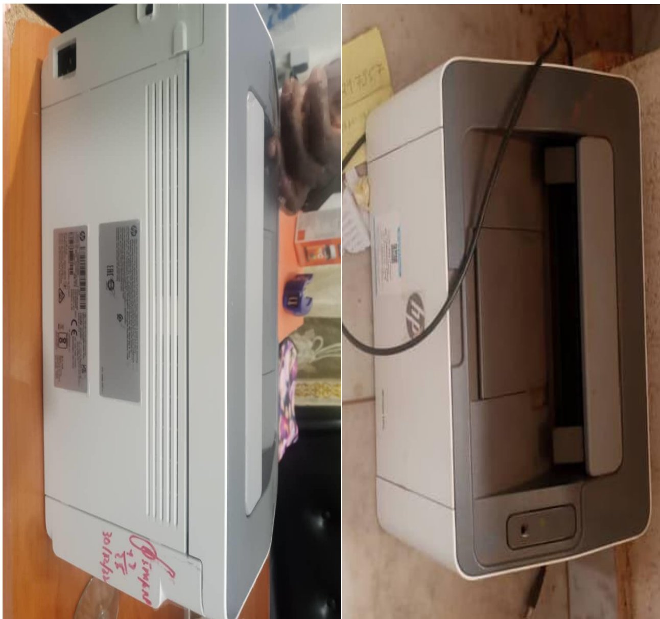
I 1 – Photos de quelques imprimantes visitées