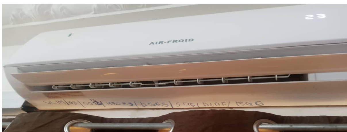
I 2 – Photos de quelques climatiseurs visités