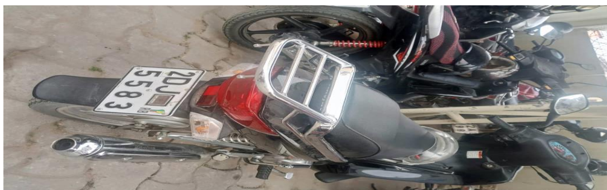
I 1 – Photos de quelques motos visitées