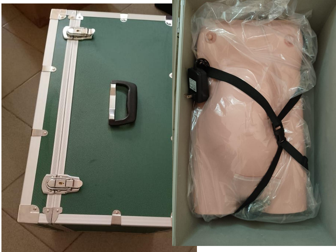
I 8 – Photo de mannequins