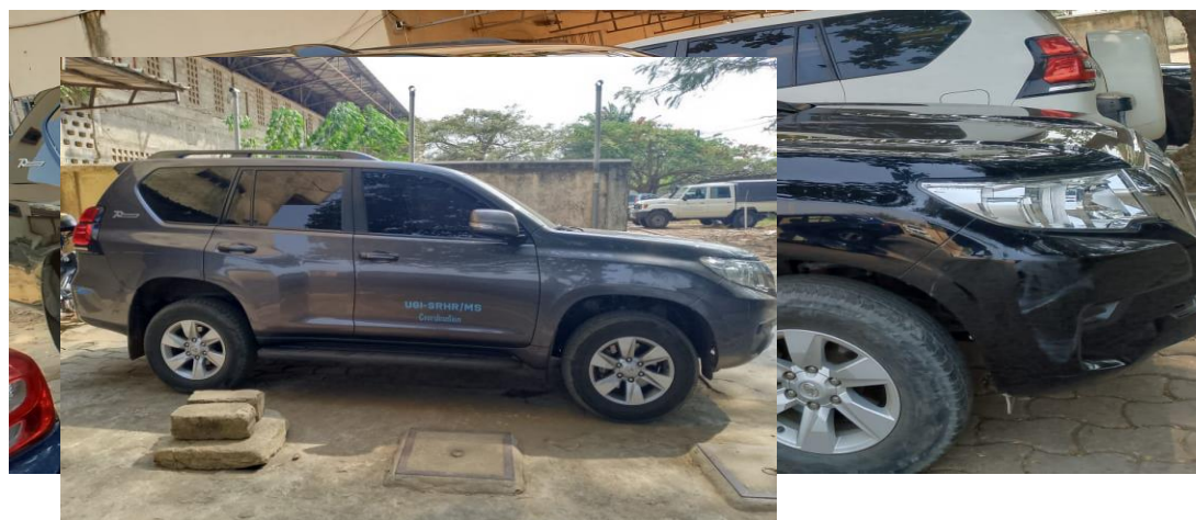
I 3 – Photo du véhicule N°2