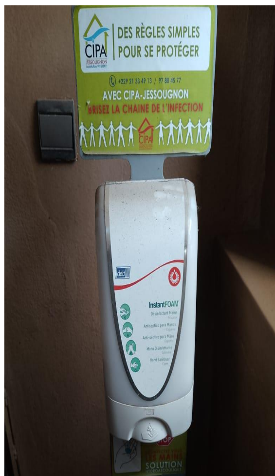
I7 – Photo de distributeur de savon liquide