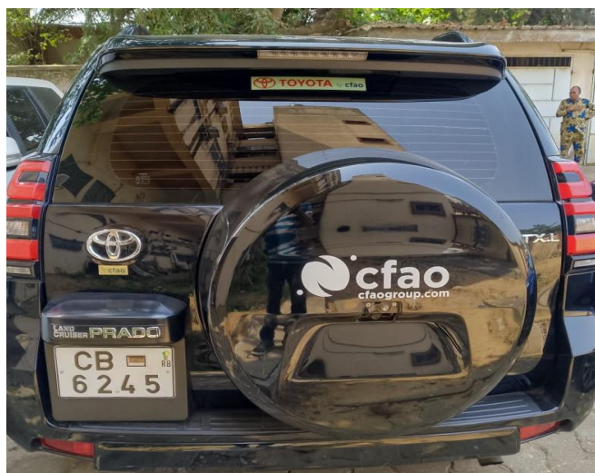
I 3 : Véhicule n°1