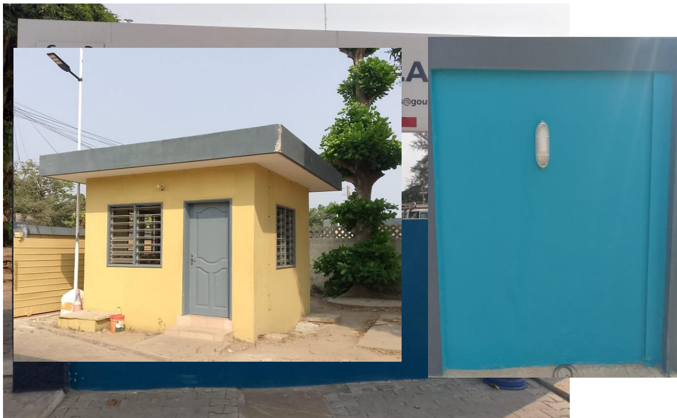
I 4 – Photo du portail du Ministère de la Santé