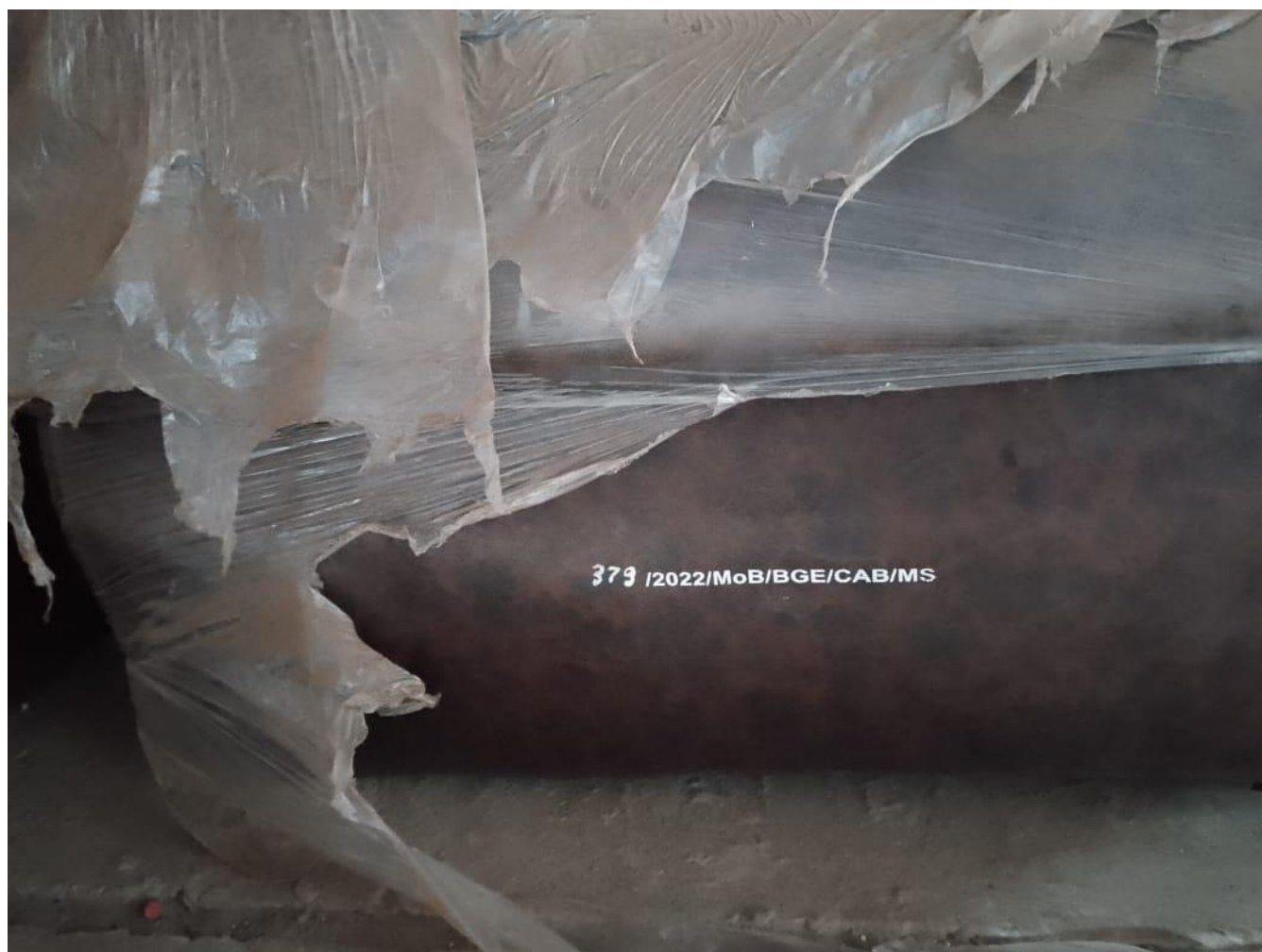
I 9 – Photo de mobilier retrouvé au magasin

Acquisition de matériels et mobiliers de bureau au profit des structures du Ministère de la Santé. LOT 1 acquisition de bureaux et fauteuil au profit de la Direction de la Planification de l'Administration et des finances (DPAF)