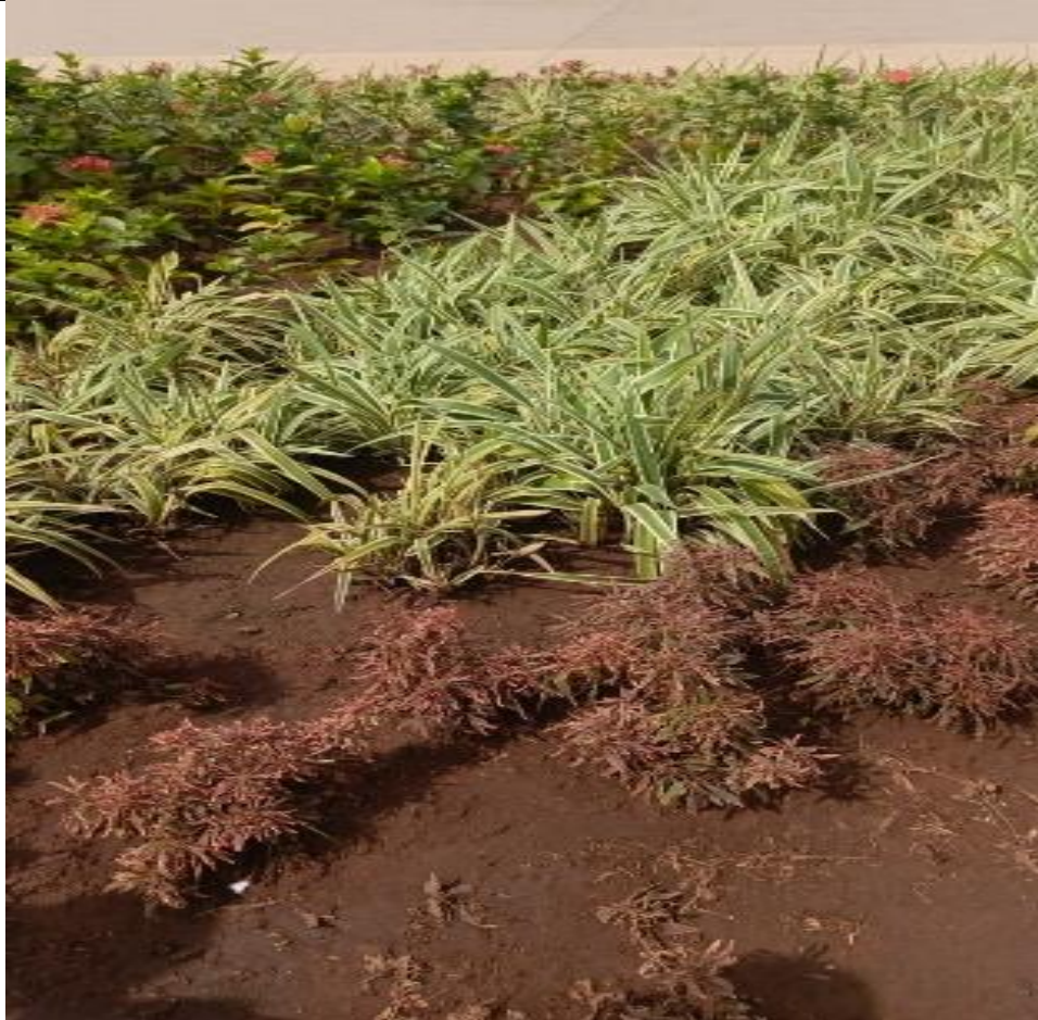
Acquisition de plantes et arbres pour la place de l'indépendance et le champ de foire sud